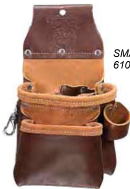
SMALL OXY 6102