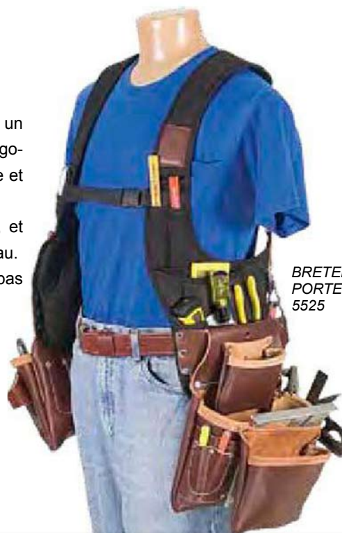
BRETELLES PORTE-OUTILS 5525