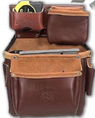
BIG OXY 5525