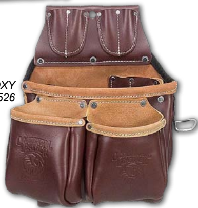
BIG OXY 5526