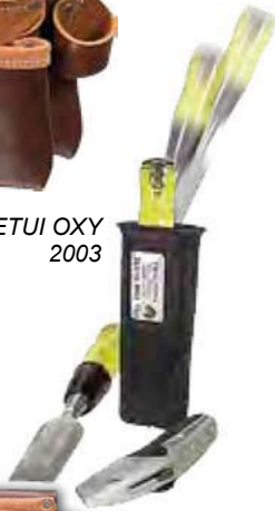
ETUI OXY 2003